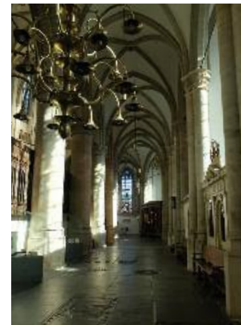
Zijbeuk van de Grote Kerk, richting Gildenramen.

Gilden hebben in Dordrecht meer dan vier eeuwen een significante rol gespeeld 8 . In later tijd waren gilden vooral gericht op protectie van materiële belangen van de leden van de groep (bescherming tegen concurrentie van buitenaf; regulering van de toetreding tot de eigen arbeidsmarkt). Meer